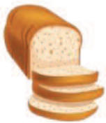
Pane integrale (100 g = 224 kcal)