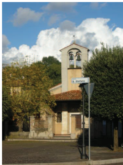
Chiesa di S. Stefano a Vermegliano

L'area compresa tra la S.P. 15 e il M. Debeli, comprendente quindi il M. Sopra Selz, la Costa Lunga, le Pradere e il M. Cosich, fino agli anni novanta fu sede di un poligono militare dove per decenni si tennero esercitazioni militari non solamente con armi leggere, ma anche con mezzi corazzati quali carriarmati e autoblindo.