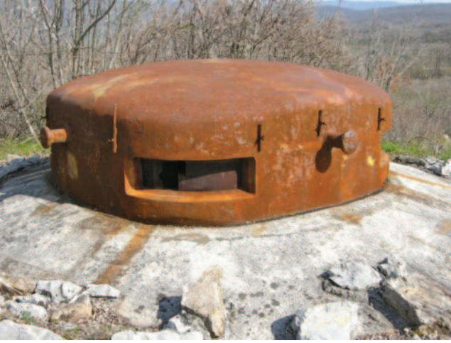
Postazione Guerra Fredda