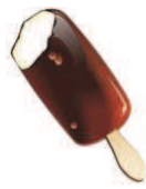
Gelato (100 g = 316 kcal)