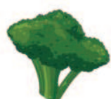
Broccoli (100 g = 27 kcal)